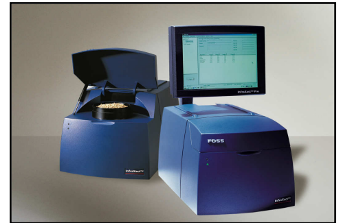
La strumentazione NIR della Diusa Pet

Nel nostro mondo qualità e sicurezza si traducono in efficienza e precisione delle tecnologie. Il nostro laboratorio di controllo qualità è fornito di una moderna apparecchiatura NIR (Near Infrared Spectroscopy) con la quale effettuiamo controlli in tempo reale (circa 50 secondi di analisi) ingresso e in uscita di materie prime e prodotti finiti tal quali. La tecnologia NIR è un grande vantaggio per noi, per voi, per i nostri amici e per l’ambiente.